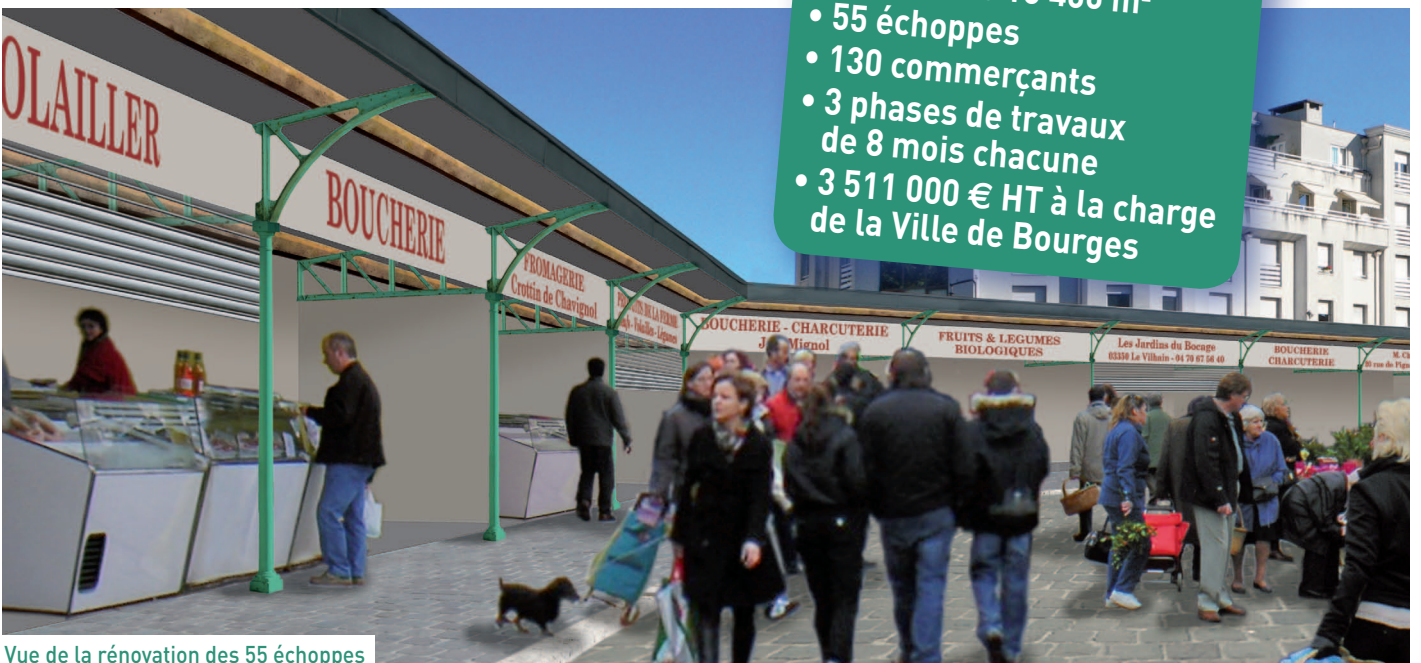
Vue de la rénovation des 55 échoppes