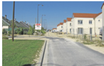
Rue Coppée en travaux avec l'opération Coppée à droite.

Les 70 logements restants sont en cours de construction, sur des terrains situés entre la rue Musset et la rue Coppée.