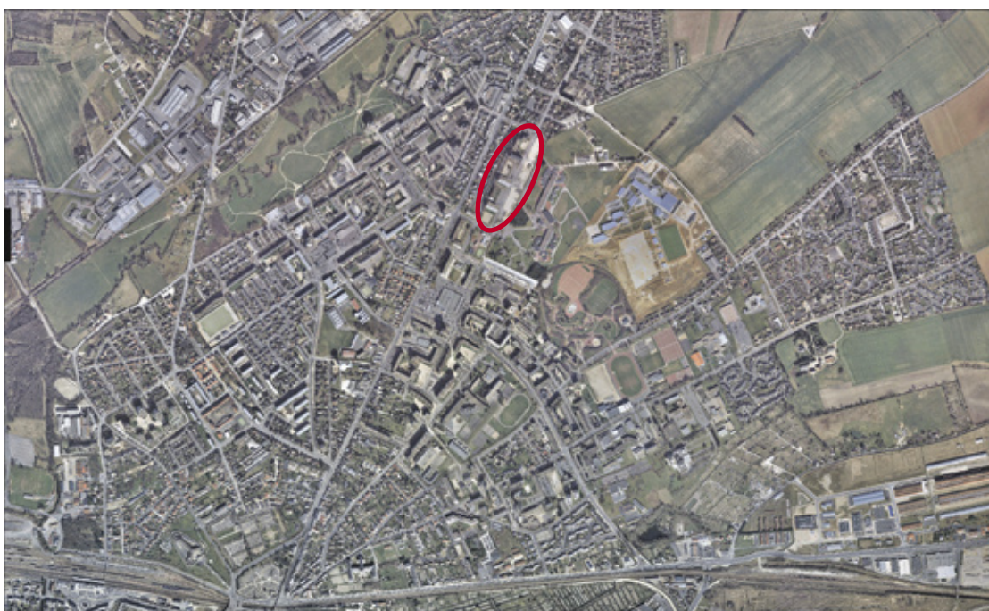
Vue d'ensemble des quartiers nord. Entouré en rouge, le secteur Musset-Coppée-Gautier.

Une partie de la rue Musset a déjà été requalifiée, pour permettre aux premiers habitants de s'installer. La rue Beaumarchais le sera début 2012, et toutes les autres pour mi-2012 : rues Coppée, Popineau, Barbusse et Mistral. Ainsi, le quartier sera définitivement achevé pour mi-2012. ■