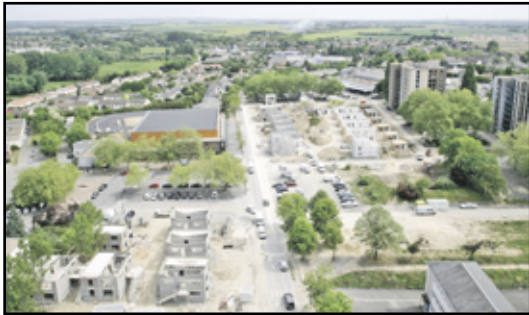
Hauts des Merlattes : - îlot A & B - 36 logements

Plus de 400 logements en construction à travers la Ville