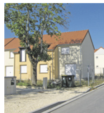
Rue Musset en travaux avec l'opération Coppée à gauche.