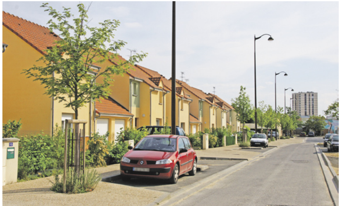
Les pavillons achevés du secteur (opération "Petits Mâchereaux") sur la rue Musset.

Ces habitations répondent aux normes THPE 2005 (Très Haute Performance Energétique), soit