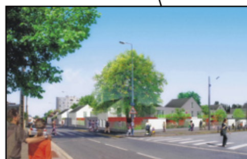
Marcel Sembat : 54 logements

ANRU Agence Nationale pour la Rénovation Urbaine