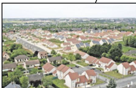
La Rottée : 17 logements / Pijolins : 26 logements Livraison : mi 2012