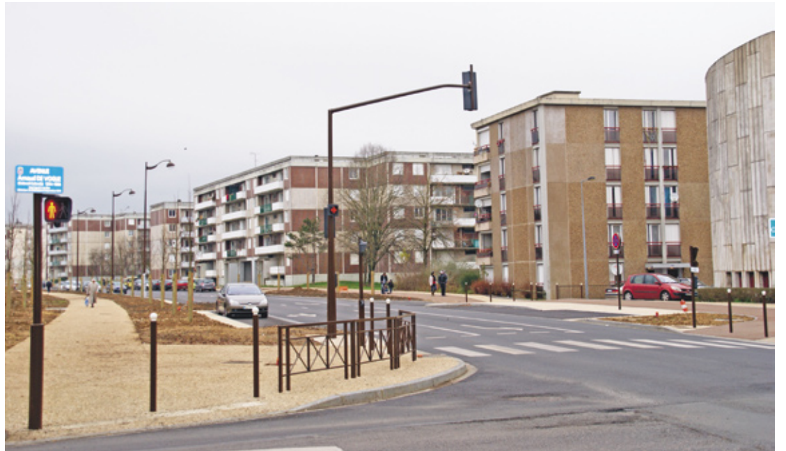
Zoom sur l'avenue de Lattre

La première tranche engagée concernait le tronçon allant du croisement de l'avenue du