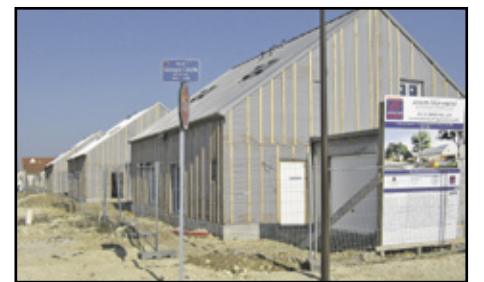
Maréchal Juin - locatifs libres : 30 logements. Livraison 1 er trimestre 2012