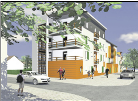
Chancellerie - îlot C 28 logements