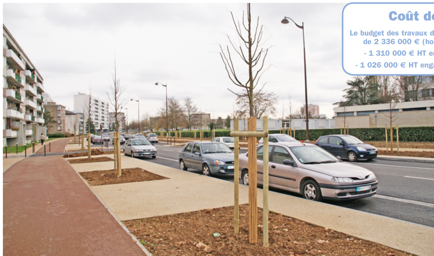
Un bel aménagement pour le quartier des Gibjoncs

en octobre 2011. Les travaux d'aménagement des espaces verts ont débuté dès le mois de novembre, et ce, pour une durée de 6 mois. La ville prend également en charge la signalisation horizontale et verticale, les feux tricolores, l'enfouissement des réseaux aériens, ou encore le mobilier urbain.