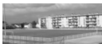
Remise à niveau du stade.

Le stade de la Sente aux Loups aura une toute autre allure au printemps 2006, pour le plus grand bonheur des joueurs et dirigeants de l'ES Moulon.