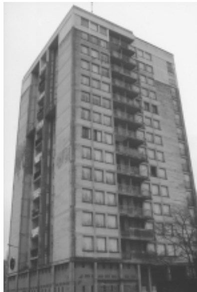
La "Tour Eiffel"

Le délai de démolition pour la "Tour Eiffel" est quand à lui de cinq mois. ■