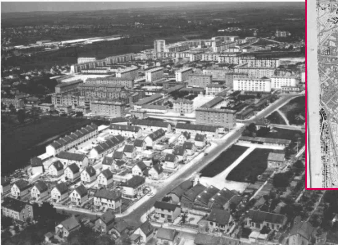
Vue aérienne de la cité du Moulon.