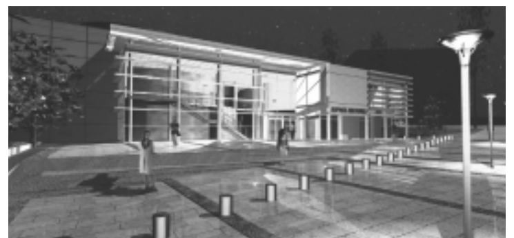
Un équipement culturel pour tous. (esquisse)