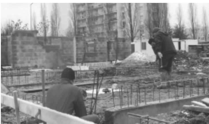
Une résidence rue Cuvier : 12 appartements.

Il devrait ouvrir ses portes à l'automne prochain. ■