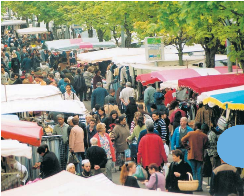
Le marché de la Chancellerie

Dans le cadre de la mise en œuvre du projet de Renouveau Urbain sur Bourges, la Ville de Bourges et l'OPAC "Bourges Habitat" vont entamer la construction de 80 nouveaux logements dans les prochaines semaines.