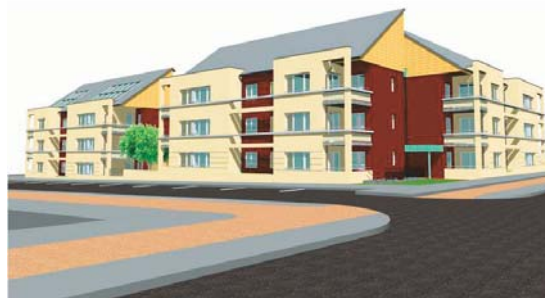
Esquisses du projet des futurs logements collectifs

Des logements adaptés seront réalisés au rez-de-chaussée des maisons de ville ainsi que dans les deux petits immeubles. ■