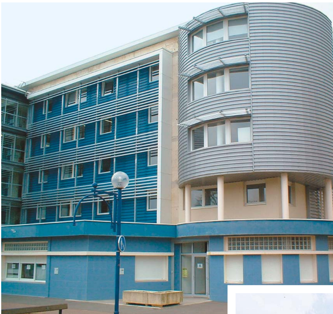
La plateforme de services publics