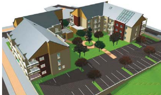
Esquisses du projet des futurs logements collectifs