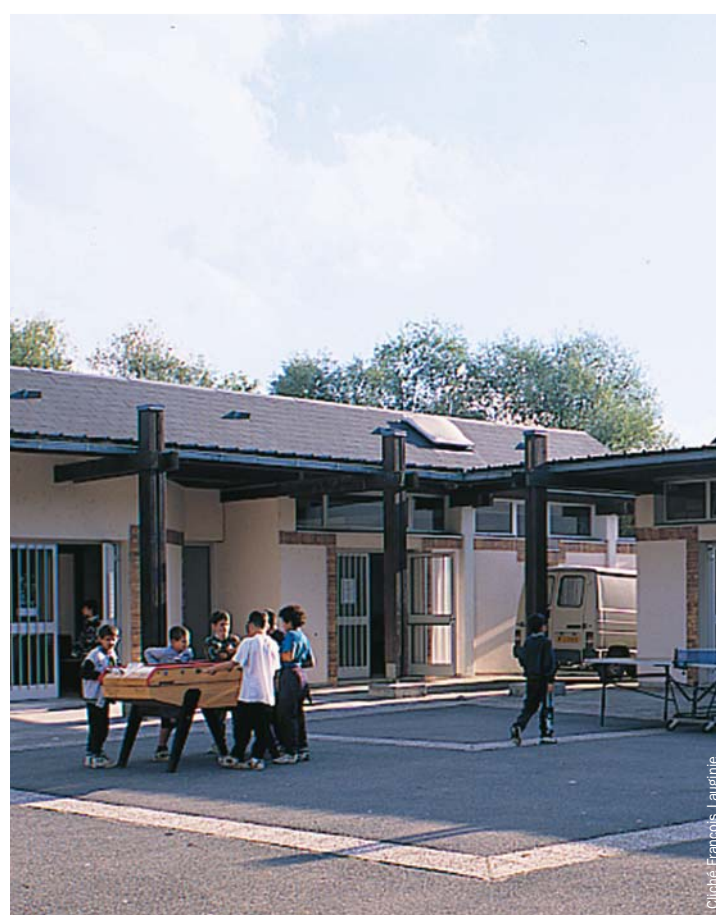
Le hameau de la Fraternité

Voués, à l'enseignement depuis leur création, le Nord de Bourges accueille, outre neuf groupes scolaires, le lycée agricole et le lycée Alain Fournier, la faculté des sciences et l'Institut Universitaire de Technologie. C'est la plus forte concentration d'établissements d'enseignement de la ville.