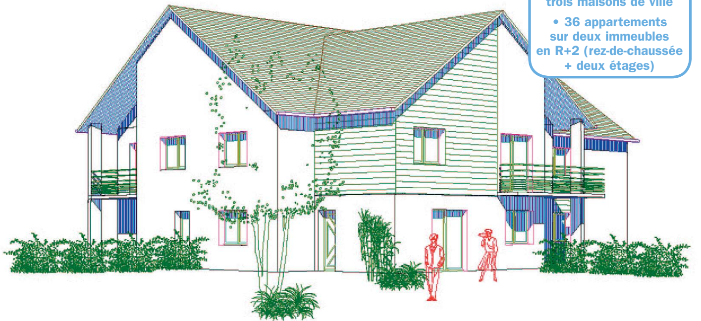
Esquisse d'une future maison de ville