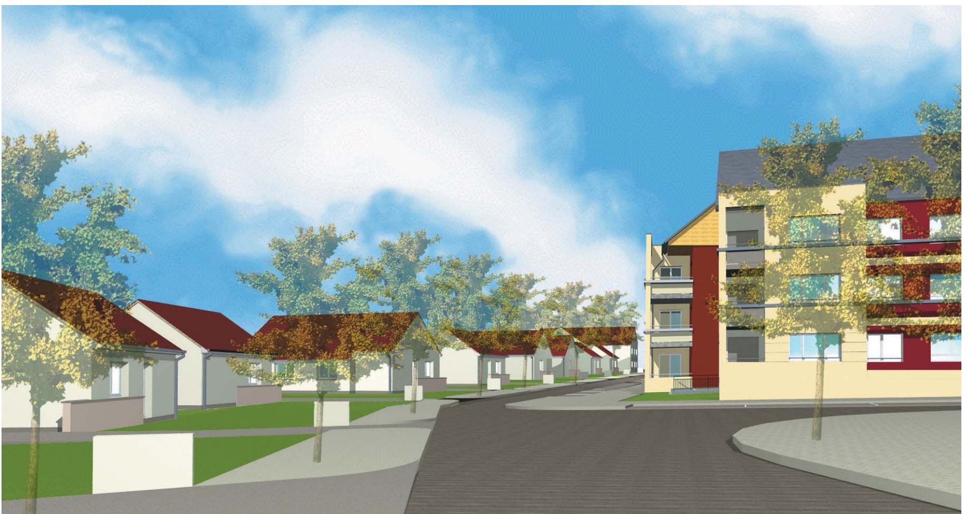
Perspective des futurs pavillons et logements locatifs