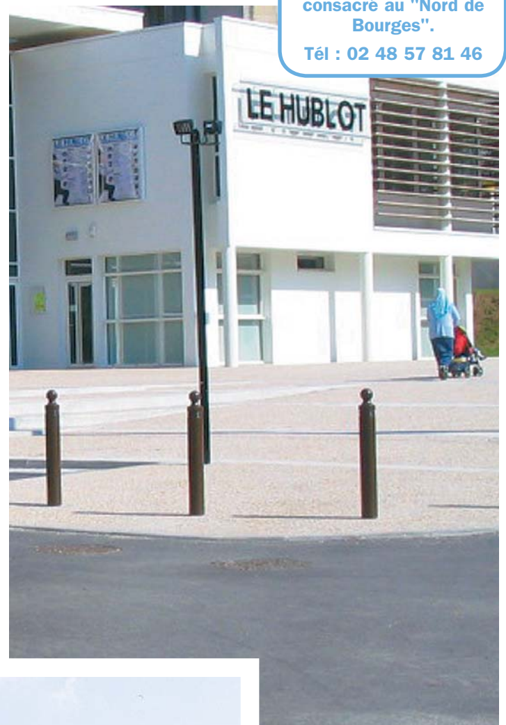
Le Hublot : un lieu de vie culturel