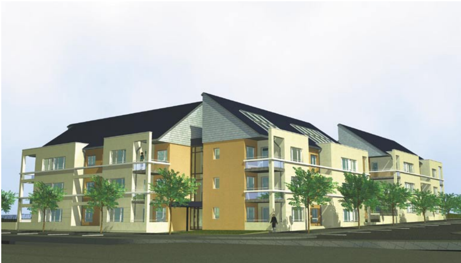
Vue 3 D du projet