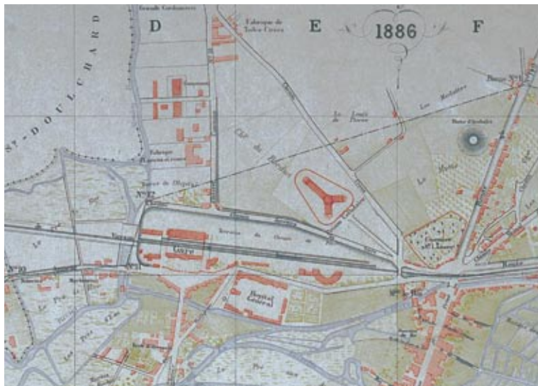
Bourges en 1886, plan Delafosse

Depuis 1853, la gare est construite côté sud et un accès vers le quartier du Moulon se révèle nécessaire pour les habitants et les ouvriers employés dans les usines situées au nord de la voie ferrée.