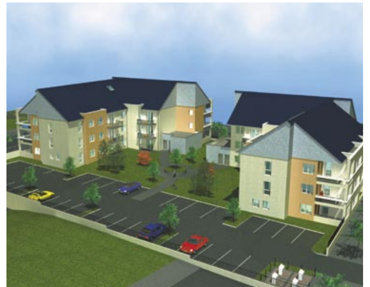
Vue 3 D du projet

Les logements seront livrés également fin 2008. ■