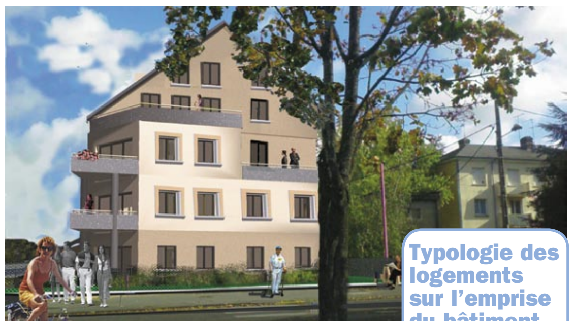
Vue 3D du futur bâtiment

30 logements en lieu et place de l'ancien immeuble "P"