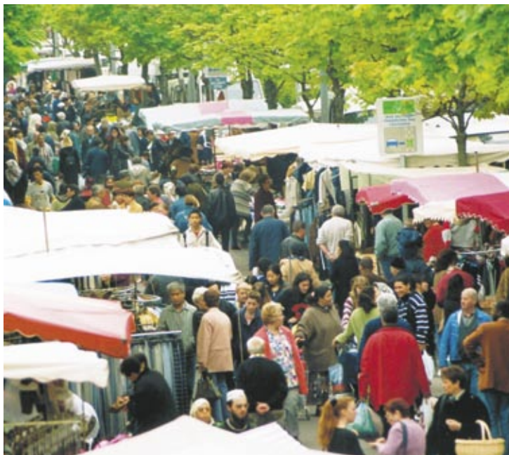
Marché de la Chancellerie

Dans le cadre du programme de Renouvellement Urbain, un réaménagement complet du centre commercial de la Chancellerie est prévu. La ville de Bourges poursuit ses acquisitions en vue de créer un nouveau centre de quartier sur la Chancellerie.