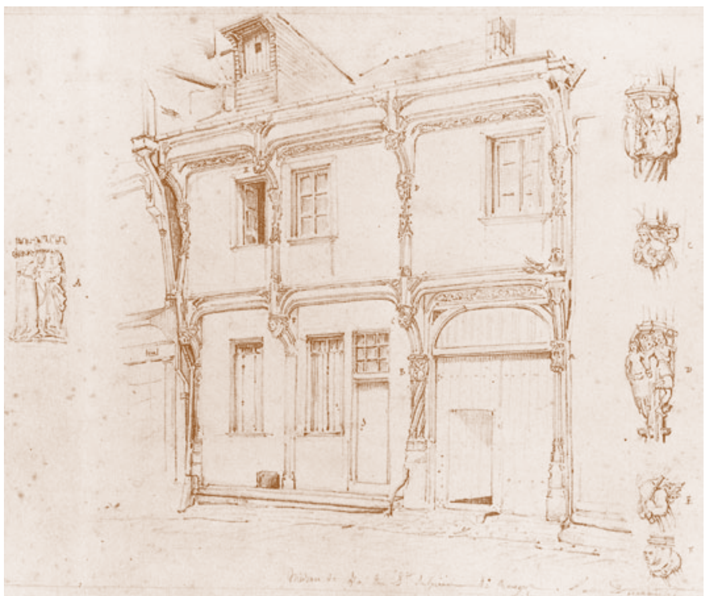
Dessin de la façade par Jules Dumoutet (1860), état avant restauration ; d'après cliché Inventaire Général Centre.

Cette maison construite après l'incendie de 1487, pour Ursin de Sauzay, échevin de Bourges, possédait à l'origine deux étages. Restaurée en 1930, elle conserve un décor sculpté unique à Bourges : des scènes religieuses (Annonciation, saint Martin partageant son manteau...) ornent les poteaux du rez-de-chaussée. Elles sont relayées à l'étage par des scènes de danse villageoise.