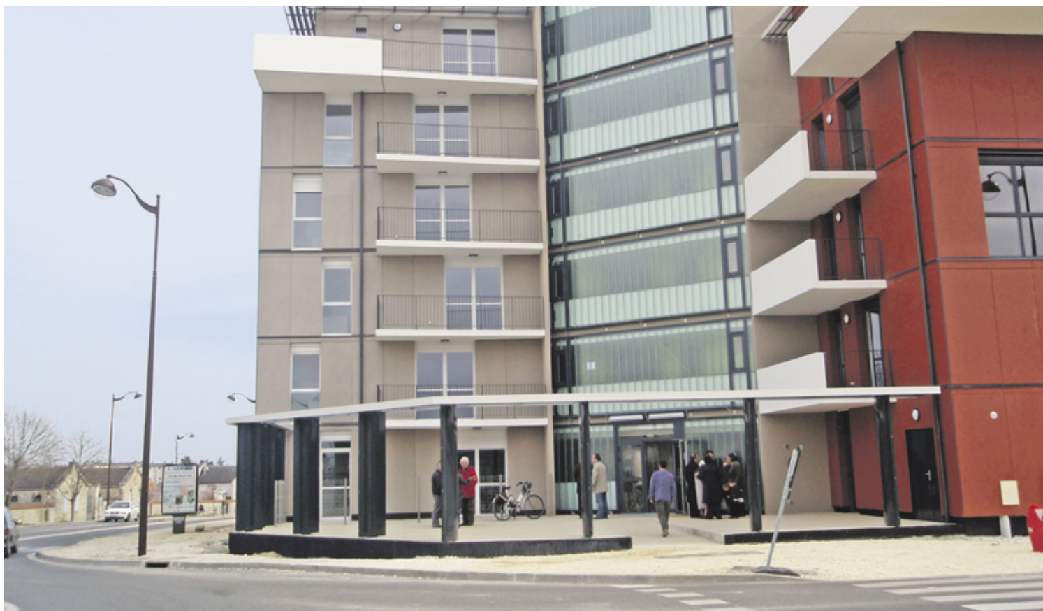
Une première dans le département : le bâtiment est de niveau BBC