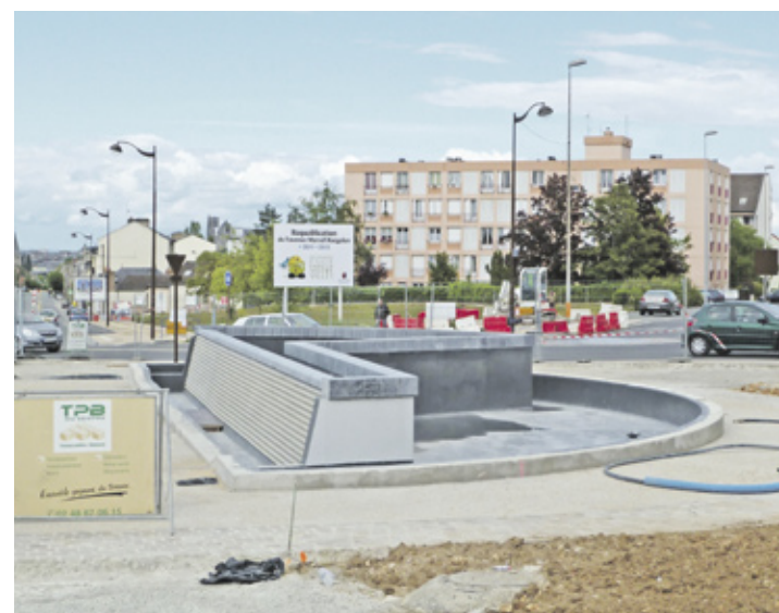
Les travaux vont bon train pour la fontaine du Lautier

L'accès au carrefour est assuré par deux giratoires, rue des Frères Voisin ainsi qu'à l'angle de la rue Le Brix. D'autres aménagements de voirie ont été réalisés afin de fluidifier l'entrée et la sortie des véhicules. Ainsi, rue Nungesser et Coli, le trottoir est élargi afin d'optimiser la sortie des véhicules. De même, le sens de circulation a été repensé : la rue est désormais en sens unique, en direction du carrefour du Lautier. ■