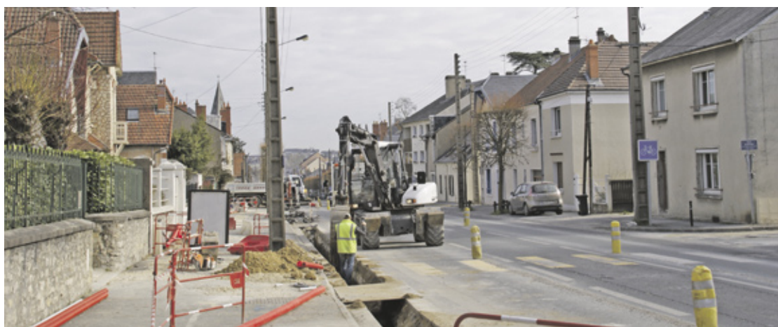
Le chantier a déjà débuté

site propre ; limiter la prédominance routière du secteur avec un traitement urbain qualitatif (traitement des surfaces, plantations...).