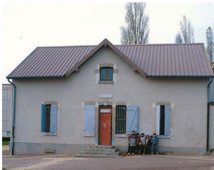
"Ferme" des Pressavois, dernier vestige des exploitations agricoles qui occupaient le plateau ; la ferme des Pressavois accueille aujourd'hui des services de la ville.

Avec sa colline aux écritures, son bassin animé, son itinéraire fleuri, ses portes végétales et ses gradins de rencontre, il reprend l'ensemble du vocabulaire paysager traditionnel des jardins occidentaux. ■