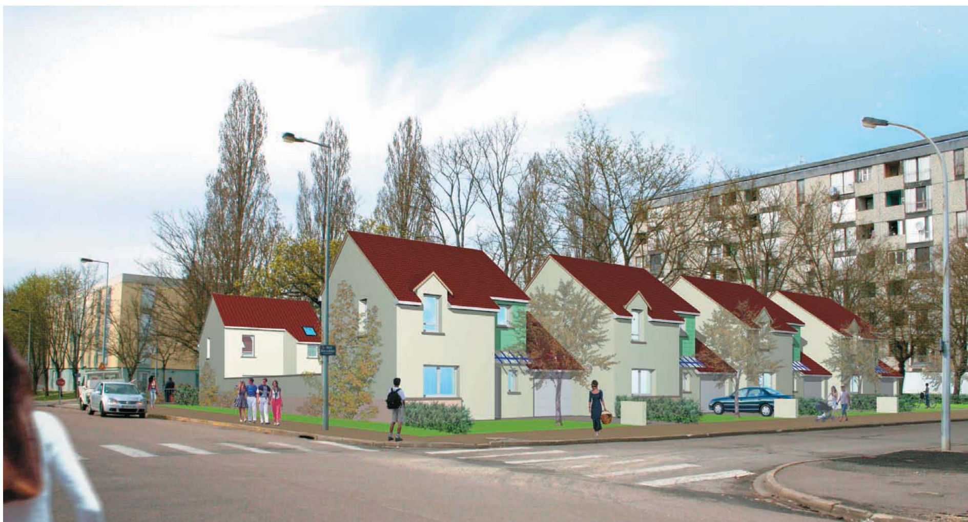
Esquisse des futurs pavillons individuels