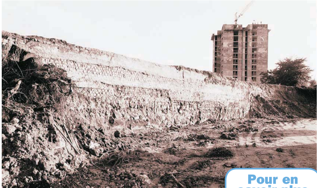
Portion d'aqueduc découvert lors de la construction du centre commercial des Gibjoncs