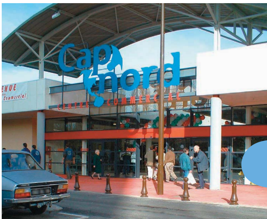
Le centre commercial "Cap nord"

Dans le cadre de la mise en œuvre du projet de Renouveau Urbain sur Bourges, la Ville de Bourges et l'OPAC Bourges Habitat vont entamer la construction de 95 nouveaux logements à compter du mois de septembre prochain.