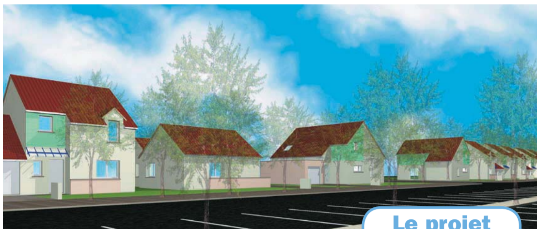
Esquisses du projet des futurs logements individuels

L'ensemble sera construit à l'issue de la démolition des bâtiments JC-JD-JE qui devrait avoir lieu au cours du premier semestre 2007. ■