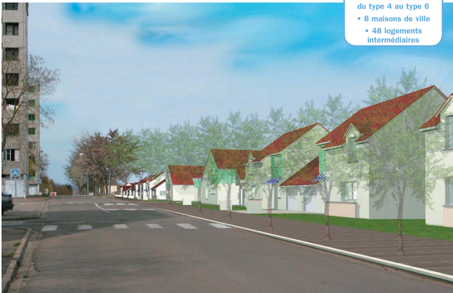
Esquisse des pavillons construits rue Alfred de Musset