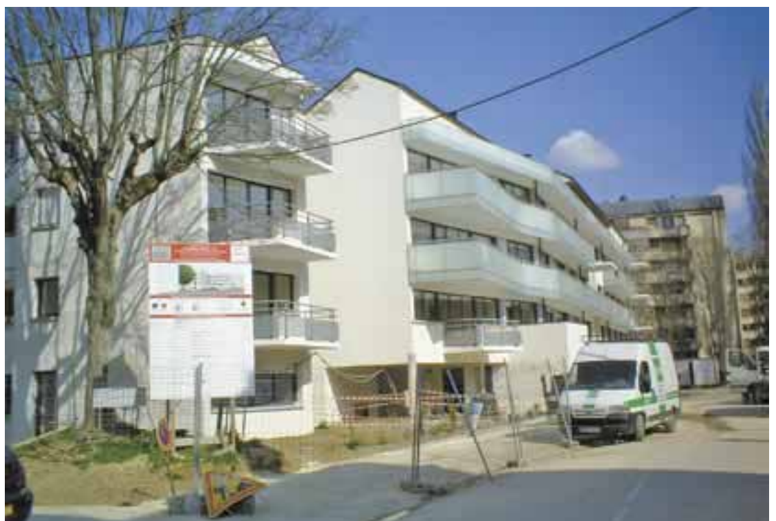
La résidence du Bouillet en cours d'achèvement