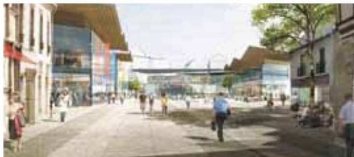
Vue depuis la rue de la Poëlerie

Le projet se caractérise par une ouverture de l'ensemble sur le quartier environnant : ouverture sur le quartier piétonnier, grâce aux liens établis avec la rue de la Poëlerie et la rue de l'abbé Berthault, ouverture côté ouest