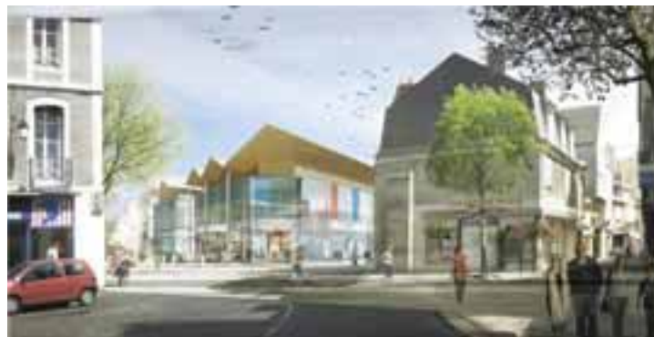
Vue depuis l'angle de la rue Mirebeau et de la rue Pelvoysin

façade associe le verre et le métal, la pierre et le bois et affirme une architecture sobre et moderne.